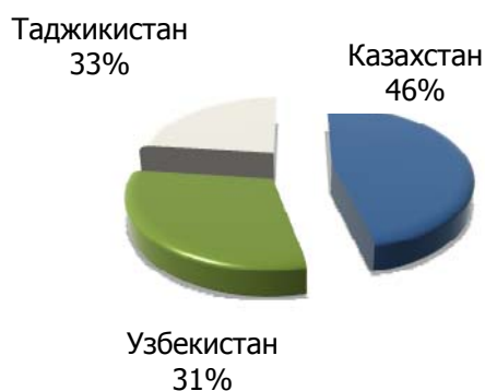
Доли абонентов WiMAX в ШДП, 2007-2008