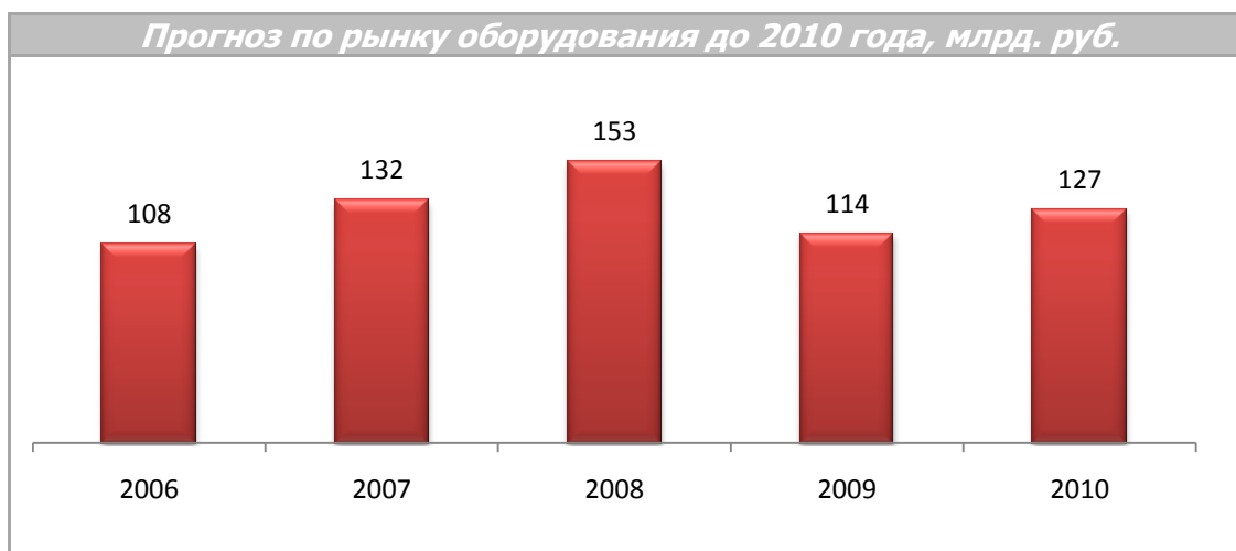
Прогноз по рынку оборудования до 2010 года, млрд. руб.

Среди вендоров телекоммуникационного оборудования в России, ведущим является Nokia Siemens, следом идут Ericsson, Cisco и Huawei.